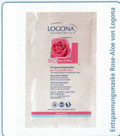
Entspannungsmaske Rose-Aloe von Logona

Diese Produkte finden Sie in Ihrem Fachgeschäft: