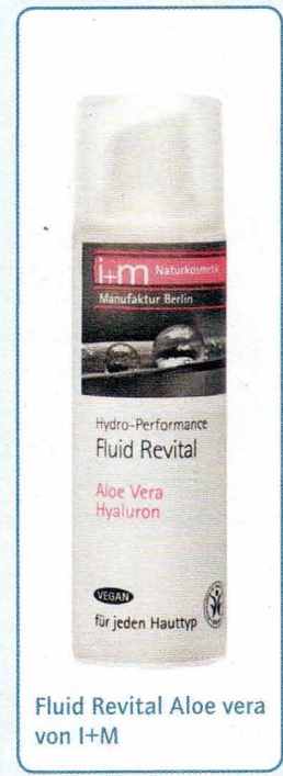
Fluid Revital Aloe vera von i+m