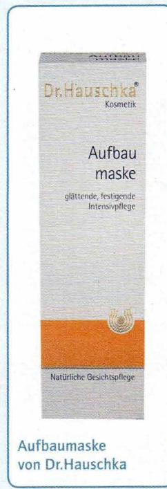
Aufbaumaske von Dr. Hauschka