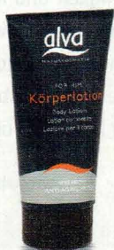
Alva for him Körperlotion von Alva, 175 ml, 9,79 Euro